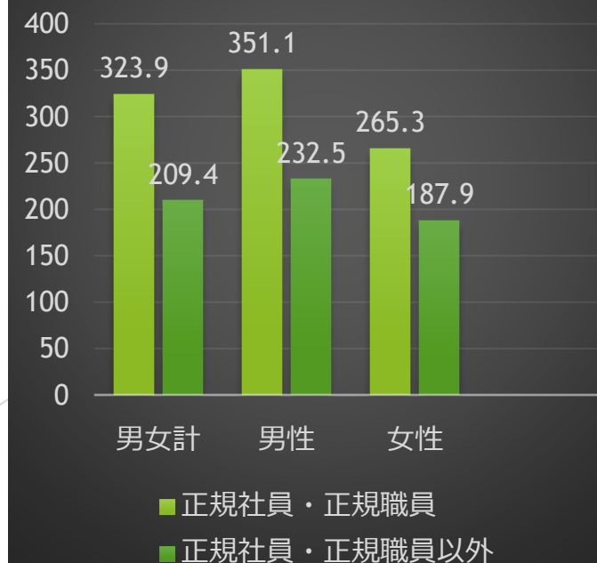
雇用形態別平均賃金 (男女別、千円)

教育・訓練期間の違いで男女の教育格差が生まれ、それが男女の雇用・賃金の格差につながる。男女間賃金差は、職階段(部長、課長、係長などの役職)の違いや、勤続年数の違いが賃金格差の問題に影響している