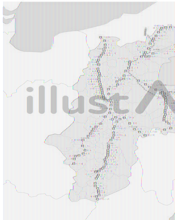
長野県の鉄道 令和3年度現在