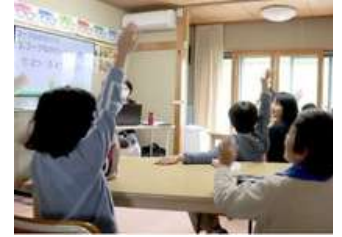
コープながの様による出前授業

松本深志高校1年生の探求人ワークショップの時間に、ジェンダーについて考える授業が開催されました。