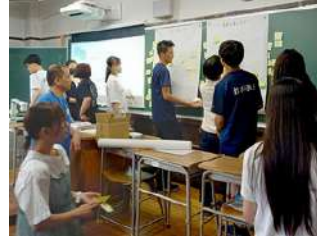
プラン・インターナショナル・ジャパン様による出前授業

下伊那農業高校で公衆衛生の授業の一環として、発展途上国における食品衛生のお話を聞きました。