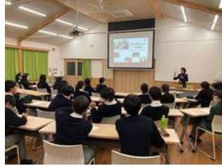
国際協力機構（JICA）様による出前授業

金融に興味がある、屋代高校1年生5名がキャリア教育の一環として、野村証券様を訪問しました。