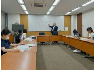
野村証券様による出前授業

飯田市立上久堅小学校 グリーン・ヒルズ小学校 安曇野市立堀金中学校 中野市立高社中学校 屋代高校 松本深志高校 上田染谷丘高校 岡谷東高校 下伊那農業高校 松本大学教育学部